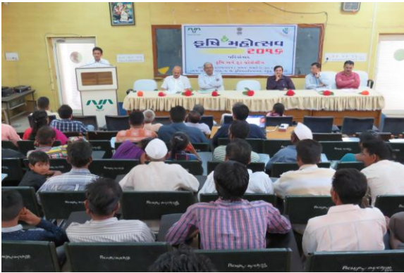
કૃષિ અને ફૂડ પ્રોસેસિંગ સેમિનાર દરમ્યાન ઉપસ્થિત મહાનુભાવો, ખેડૂતો અને વક્તવ્ય આપતા અધિકારી