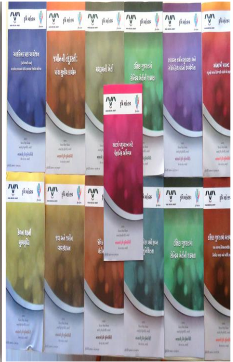
વિવિધ ૧૩ વિષયોના ફોલ્ડર્સ