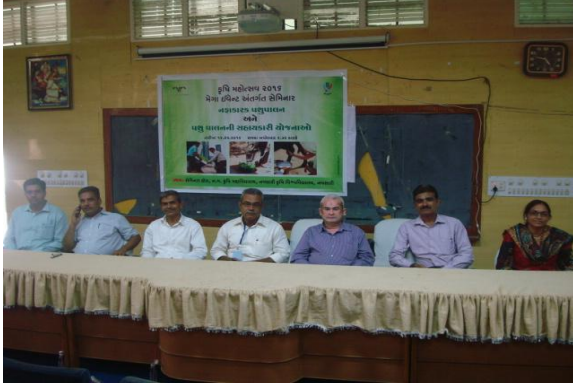
પશુપાલન સેમિનાર દરમ્યાન ઉપસ્થિત મહાનુભાવો, ખેડૂતો અને વક્તવ્ય આપતા કૃષિ વૈજ્ઞાનિક