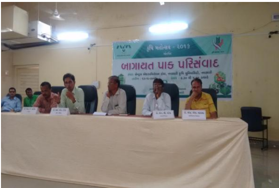
બાગાયત સેમિનાર દરમ્યાન ઉપસ્થિત મહાનુભાવો, ખેડૂતો અને વક્તવ્ય આપતા કૃષિ વૈજ્ઞાનિક