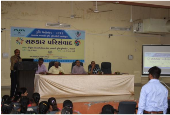
સહકાર સેમિનાર દરમ્યાન ઉપસ્થિત મહાનુભાવો, ખેડૂતો અને વક્તવ્ય આપતા અધિકારી