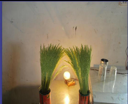
Panicles kept for anthesis