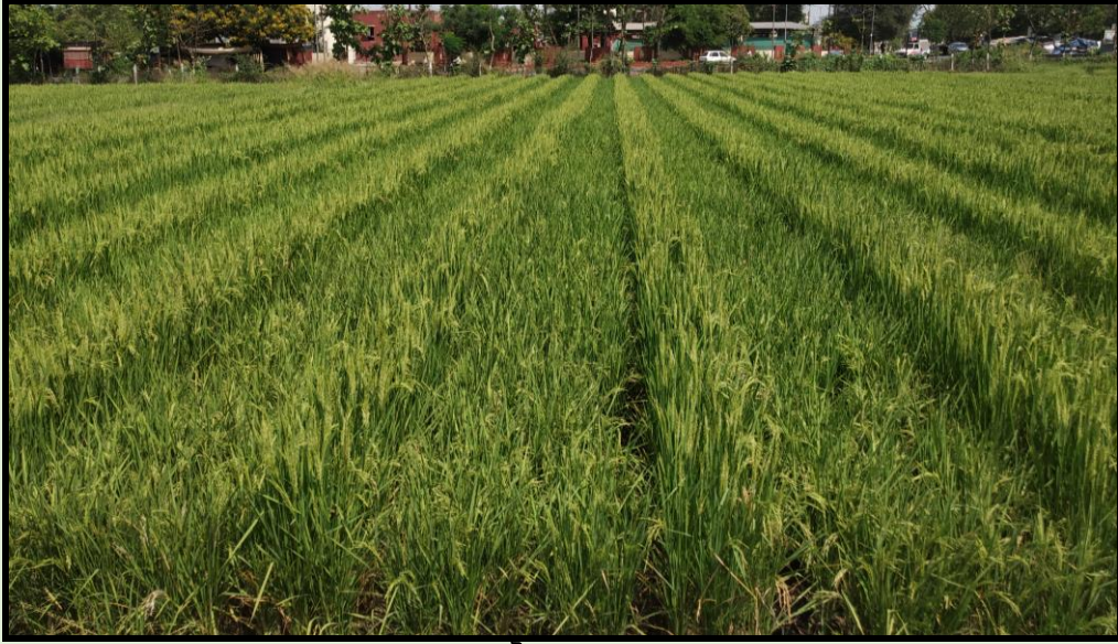
નર વંધ્ય જાતોનું બીજ ઉત્પાદન મગફળીના બ્રીડીંગ અખતરાઓ