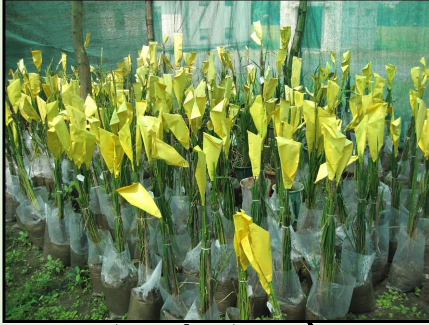
સંકરણ કરેલ ડાંગરના છોડ