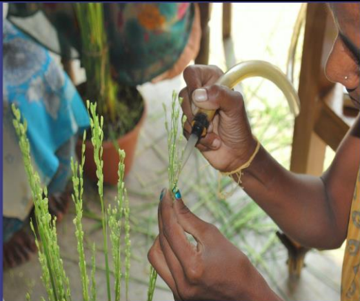
Emasculator used to remove anthers