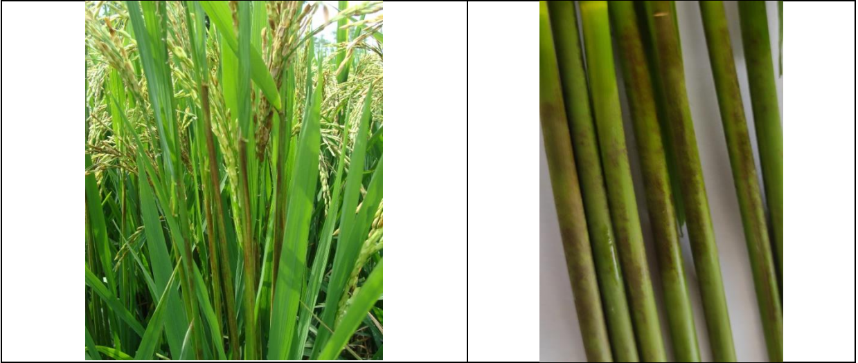
આવર્તક પર્યાંતલ ઉપર તપખીરી ડાઘા