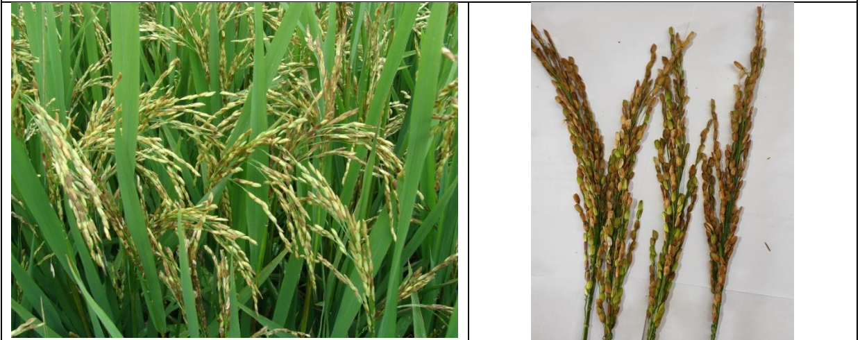
કથીરીથી ઉપદ્રવિત ડાંગરની કંટી