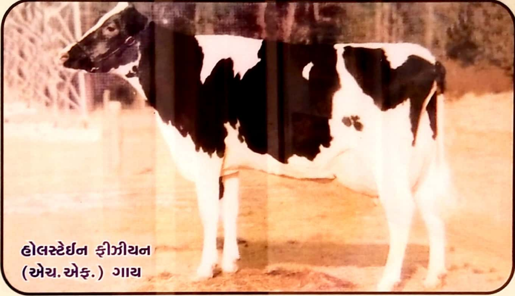
હોલસ્ટેઈન ફ્રીઝીયન (એચ.એફ.) ગાય