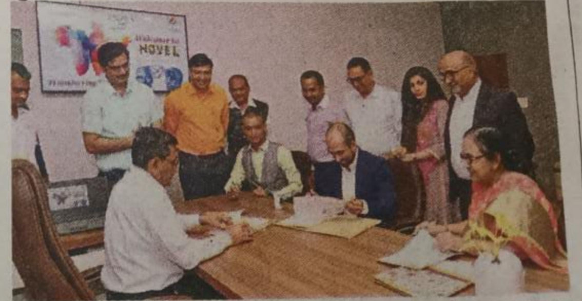
કૃષિ યુનિવર્સિટી દ્વારા આફ્રિકાની કંપની સાથે ટેકનોલોજી ટ્રાન્સફર માટે કરાર કરાયા હતા.

કરવામાં આવ્યો છે. જેના દ્વારા નવસારી કૃષિ યુનિ.ના વૈજ્ઞાનિકો દ્વારા કેળના થડમાંથી સંશોધન પામેલા અને હાલમાં ખેડૂતોમાં ખૂબ જ પ્રચલિત એવા નોવેલ સેન્દ્રીય પ્રવાહી કે જે આંતરરાષ્ટ્રીય પેટન્ટ પ્રોડક્ટ છે એના વૈપારિક ઉત્પાદન માટે કરાર કરવામાં આવ્યાં છે. આ નોવેલનું આફ્રિકામાં ઉત્પાદન કરી આખા આફ્રિકાખંડ માટે વેચાણ માટેનું ... અનુસંધાન પાના નં.3