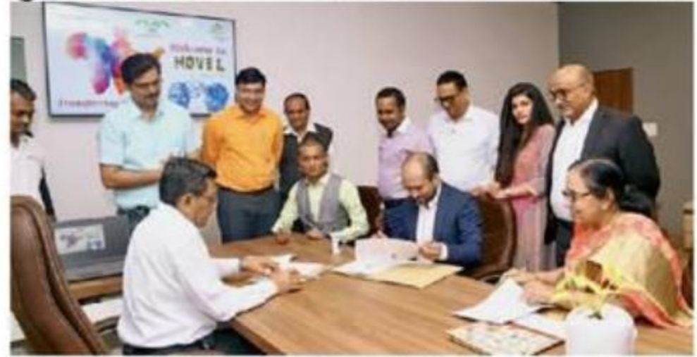
કૃષિ યુનિવર્સિટી દ્વારા આફ્રિકાની કંપની સાથે ટેકનોલોજી ટ્રાન્સફર માટે કરાર કરાયા હતા.

કરવામાં આવ્યો છે. જેના દ્વારા નવસારી કૃષિ યુનિ.ના વૈજ્ઞાનિકો દ્વારા કેળના થડમાંથી સંશોધન પામેલા અને હાલમાં ખેડૂતોમાં ખૂબ જ પ્રચલિત એવા નોવેલ સેન્દ્રીય પ્રવાહી કે જે આંતરરાષ્ટ્રીય પેટન્ટ પ્રોડક્ટ છે એના વૈપારિક ઉત્પાદન માટે કરાર કરવામાં આવ્યાં છે. આ નોવેલનું આફ્રિકામાં ઉત્પાદન કરી આખા આફ્રિકાખંડ માટે વેચાણ માટેનું ... અનુસંધાન પાના નં. 3