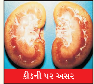
કીડની પર અસર