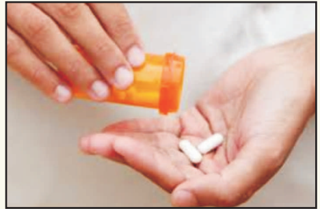
સમયસર દવા લેવી.