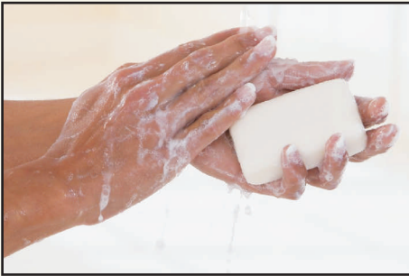
સાબુથી હાથ પગ સાફ કરવા

લેપ્ટોસ્પાયરોસીસ રોગથી બચવા માટે જાણકારી, સમયસર નિદાન અને સારવાર જરૂરી છે.