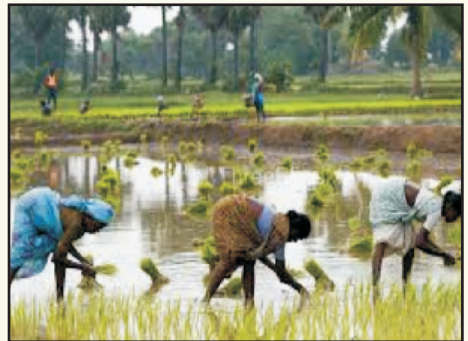
કામ કરતી વખતે મોજા તથા ગમબુટનો ઉપયોગ કરવો.